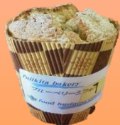
桑の実タルト・桑の実ティラミス・シフォンケーキ