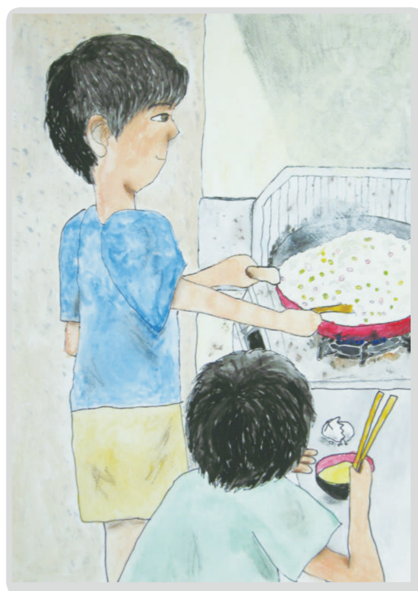
弟と作るチャーハン